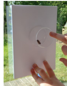
Elle glisse la feuille de carton sous la boîte (sans coincer l'insecte !)