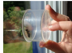
Elle coiffe l'animal de sa boîte