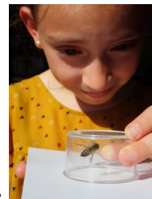
Et là, elle peut observer en toute tranquillité